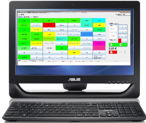
Kassapäätteen tai kassatietokone